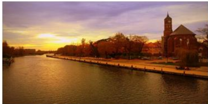
Europe Direct Informationszentrum Brandenburg a. d. Havel

Die Stadt Brandenburg sanierte im Rahmen des EFRE-Programms Teile ihrer Haveluferpromenaden zwischen Luckenberger Brücke und Jahrtausendbrücke . Die Uferpromenade hat auf Grund ihrer exponierten und zentrumsnahen Lage innerhalb der Stadt eine hervorragende Eignung als Aufenthaltsbereich für Erholungssuchende und als innerstädtischer Fuß- und Radweg. Sie wurde durch die Sanierung der Wege, der Beleuchtung und der Herrichtung der Uferböschung gestalterisch deutlich aufgewertet.